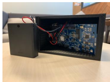
△プロトタイプ(内観)